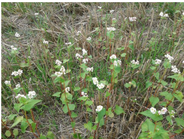
Abbildung 5: Buchweizen Mitte September, Rein- saat , mit dem Schneckenkornstreuer vor der Weizenernte gestreut. Auf Bodenbearbeitung wurde vollständig verzichtet (Demofläche).

Fazit: Gut etablierte Zwischenfrüchte können Dünger sehr gut verwerten.