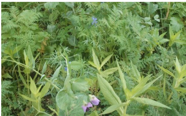
Abbildung 4: Erbse, Phacelia, Ramtilkraut, Anfang November. Dicht und vielfältig