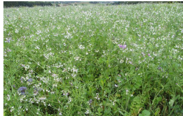
Abbildung 1: Gelingene Zwischenfrucht nach Wintergerste, Anfang Oktober

Einige Betriebe säen ihre Zwischenfrucht unmittelbar nach der Gerstenernte, d. h. in aller Regel noch im Juli. Aber auch nach den anderen Getreidearten sind normalerweise Aussaten bis spätestens 10. August möglich. Alternativ können Sie die erste Welle des Ausfallgetreides abwarten, dann nach ca. 14 Tagen flach bearbeiten und direkt danach die Zwischenfrucht säen.