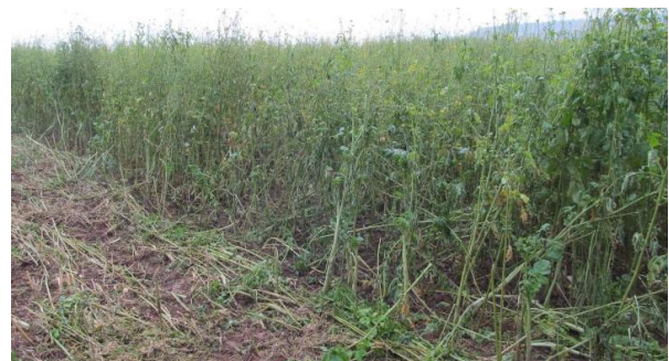
Abbildung 3: Sehr hoher Senf in Reinsaat, 20. Dezember. Viele Stängel, wenig Masse.

Dabei bieten sich u. a. Phacelia, Ramtillkraut und verschiedene Kleearten an. Im Idealfall wählen Sie Kulturen mit unterschiedlichen Wurzelsystemen: Flach- und Tiefwurzler, Leguminosen und Nicht-Leguminosen. Bei getreidebetonten Fruchtfolgen raten wir grundsätzlich von Gräsern in der Mischung ab.